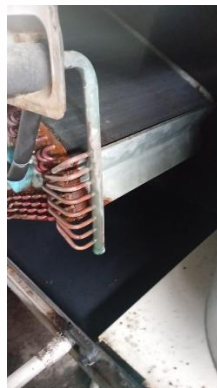
Serpentín Unidad Evaporadora (Después del Mantenimiento)