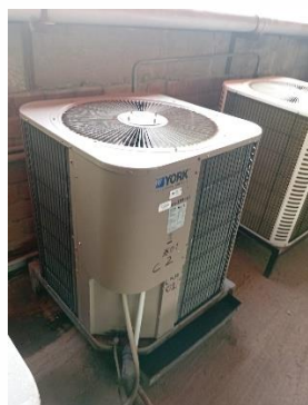
Unidad Condensadora (Después del Mantenimiento)