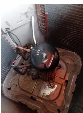
Compresor Unidad Condensadora (Después del Mantenimiento)