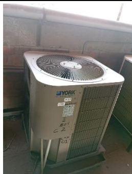
Unidad Condensadora (Antes del Mantenimiento)